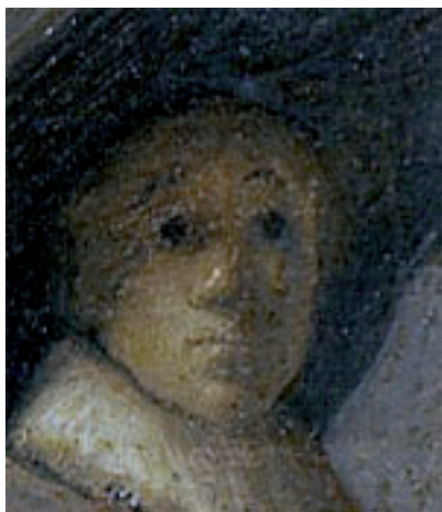
Exemple de tableau de peintre du XIXème siècle, étudié par l'équipe.

Ses mots-clés sont : Analyse chimique, Analyse élémentaire, Analyse in situ, Analyse sur site, Analyse trace, Archéologie, Caractérisation nanométrique, Chimie analytique, Concept analytique, Dialogue science et société, Histoire de l'art, Imagerie, Instrumentation en analyse, Interaction rayonnement matière, Méthodologie analytique, Miniaturisation, Nanoparticule, Plateforme analytique, Portabilité, Quantification données, RayonsX, Sciences analytiques, Solubilité, Spéciation, Spectrométrie, Traceur, Traitement données, Transfert technologie innovante.